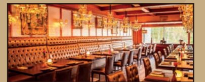
Sonseweg 3, 5492 HK Sint-Oedenrode

Neem een kijkje op onze bestelsite! Ga naar www.lounge8-bestellen.nl of scan de QR code voor de website.