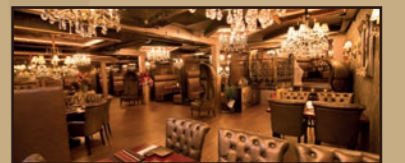
Raadhuisstraat 70, 4701 PV Roosendaal